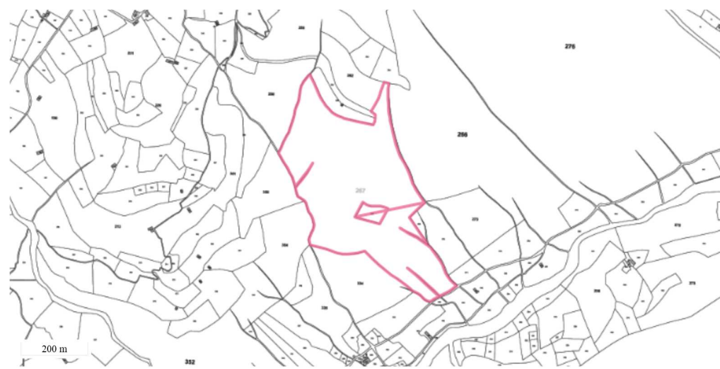
Périmètre du SIS Parcelles cadastrales - IGN